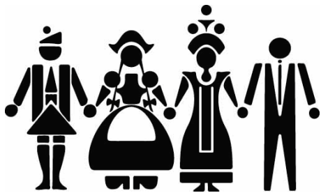
Rotary Friendship Exchange